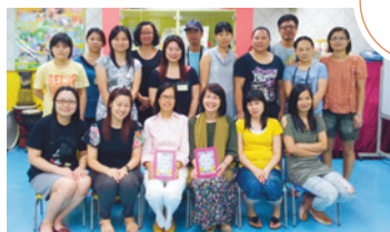
基法幼稚園與梁發紀念禮拜堂堂校合作事工。

雙方已有數十年合作無間，希望透過學校，家長更認識主耶穌。每年舉辦「家長系列課程」全年共十二堂。在每次社工分享專題後，便會分成小組，由牧者和社工透過小組聆聽家長心聲和彼此分享，建立互相扶持的同行關係。其後牧者更透過經文，讓家長學會聆聽自己的心聲和反思教養的歷程。透過小組彼此建立同行守望的關係，更透過家長早餐，讓家長感到教會的存在，就像他們第二個家。在聚會中放低做父母的身份，單單安靜聆聽和善待自己，讓家長更親近上帝。但願這福音種子，慢慢地在他們的心裡扎根成長，更認識從上帝而來的「愛」。