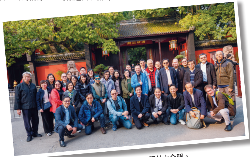
全團在武侯祠外大合照。

的確，縱使擁有曠世之才，若生不逢時，便成為人生的桎梏。在聖經中，有許多人物也有類似的經歷，例如摩西。他出生時正值以色列人受壓迫的艱難時期，本應被殺，卻因被埃及公主無意中的發現而得倖存，並且成長於皇宮之中，可說衣食無憂。後來，他因維護被苦待的以色列同胞，