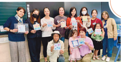
何福堂小學與龍門堂堂校合作事工。

課程，讓年長的家長發展不同的興趣及認識信仰。老師方面，龍門堂同工除了協助帶教師團契，每年也會與全體老師分組進行聚餐團契，勉勵老師們。