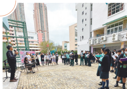
方潤華中學與天約堂堂校合作事工。

方潤華中學與天約堂進行了堂校合作多年，活動涵蓋了多個重要項目。學校資訊日提供了分享福音工作的機會，讓學生和家長了解教會使命及校牧事工。此外，校園報佳音活動吸引了多位師生參加，透過聖誕詩歌傳遞耶穌基督的祝福。在午間團契和「鬆一