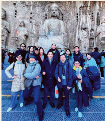
令人讚嘆的雕刻藝術水平。