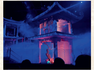
《幻影劇場》的場景設計極具特色。