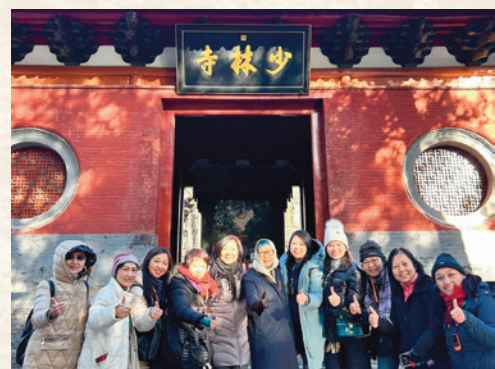
在少林寺內留下不少倩影。

少林寺位於河南省中部登封市中嶽嵩山之上，建於北魏太和十九年（公元四九五年），距今1,500餘年，是佛教禪宗祖庭，號稱「天下第一名剎」。少林寺具有深厚的建築藝術、歷史文化底蘊，少林武學「以禪入武、以武入禪」亦名揚天下。二零一零年與嵩山建築群天地之中集體入選世界文化遺產。少林寺古建築（編號7-1162）亦已於二零一三年列為第七批全國重點文物保護單位。