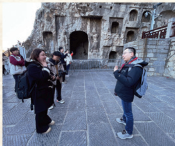
校長代表接受當地傳媒的採訪。

除了古蹟的保育及陳展外，河南省政府也致力將深厚的歷史文化揉合現代藝術的元素，向國民及世界人民展示中原文化的源流和輝煌的發展。