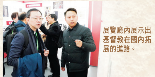
展覽廳內展示出基督教在國內拓展的進路。

河南省基督教兩會為基督教三自愛國運動委員會及基督教協會的合稱，分別為三自愛國運動地方組織及全省性基督教社會團體教務組織，成立於一九五零及一九八零年代。兩會在當地宗教生活中扮演著負責組織教會活動、培訓牧師、推動社會服務、公益事業，以及促進基督教的中國化的角色。