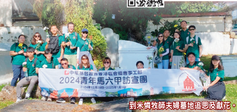
到米憐牧師夫婦墓地追思及獻花。