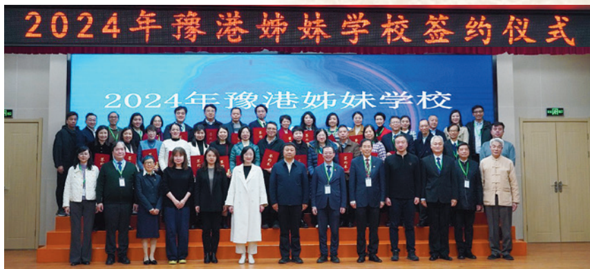
完成締結簽約儀式後大合照。

我們到埠後旋即參與重頭戲——2024豫港姊妹學校簽約儀式。在河南省教育廳的安排下，本會12所小學與