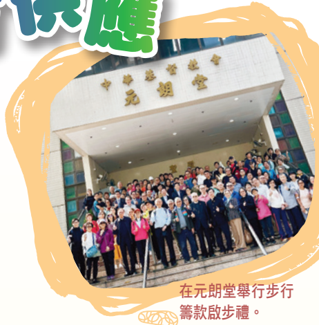
在元朗堂舉行步行籌款啟步禮。