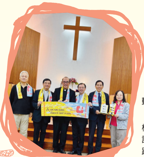
奉獻禮完結後合照。

當日下午1時30分，近一百位參加者齊集元朗堂，浩浩蕩蕩從教會出發，徒步前往新建牧師退休住所地盤。各位參加者在行到地盤時當然不忘要合照留念，之後再折返元朗堂。沿途上有