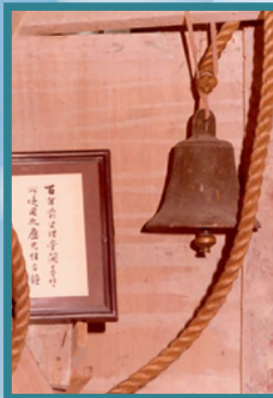
▶公理堂開基古鐘照片記錄了古鐘外貌，成為其中一份重要證據。