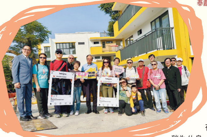
步行至地盤前合照。

警方協助維持秩序，亦有本會基元中學及基朗中學師生參與指示步行方向及提供清水或餅點作支援。元朗真光小學、元朗堂幼稚園也派出教職員協助，體現堂校一家彼此合作。