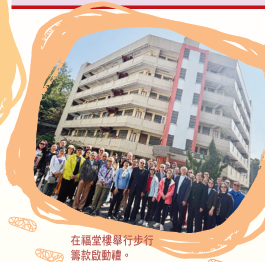
在福堂樓舉行步行籌款啟動禮。

姊妹的回應，令二零二四年的籌募目標達至六成左右。餘下的目標就要寄望步行籌款了。步行籌款的步行路線最初計劃是從屯門福堂樓行至元朗東頭村地盤。不過這段路程大概有9.6公里，若以正常步速行走，則需時兩小時十五分鐘。由於路程距離和所需時間對報名參加者的意欲有直接的影響，故此籌備小組最後決定以本會元朗堂為步行的起點，然後步行至元朗東頭村地盤，之後折返元朗堂。這段路程在一小時之內必定能夠完成，而在步行完成後，更可以在元朗堂舉行新建牧師退休住所奉獻禮，結果籌備小組就敲定這個安排。