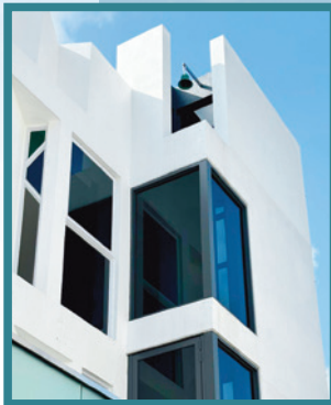
◀小小古鐘被重置於林馬堂新聖堂樓頂，即便遠觀仍清晰可見。