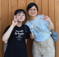
滙聲 806 期