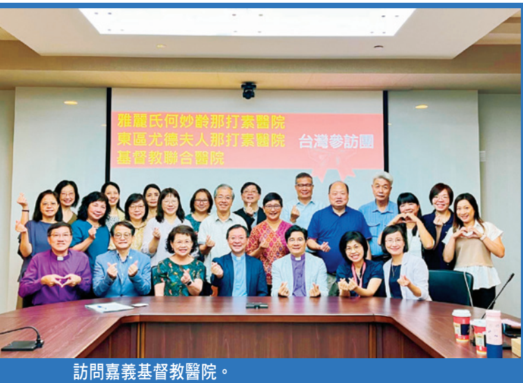
訪問嘉義基督教醫院。

們對CPE督導的想像。此外，我們還參觀了嘉義基督教醫院的安寧病房，病房的佈局充分考慮到病人及其家屬的需要，讓我們深受感動。